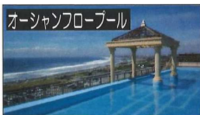
オーシャンフロール