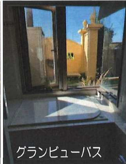
グランビューバス